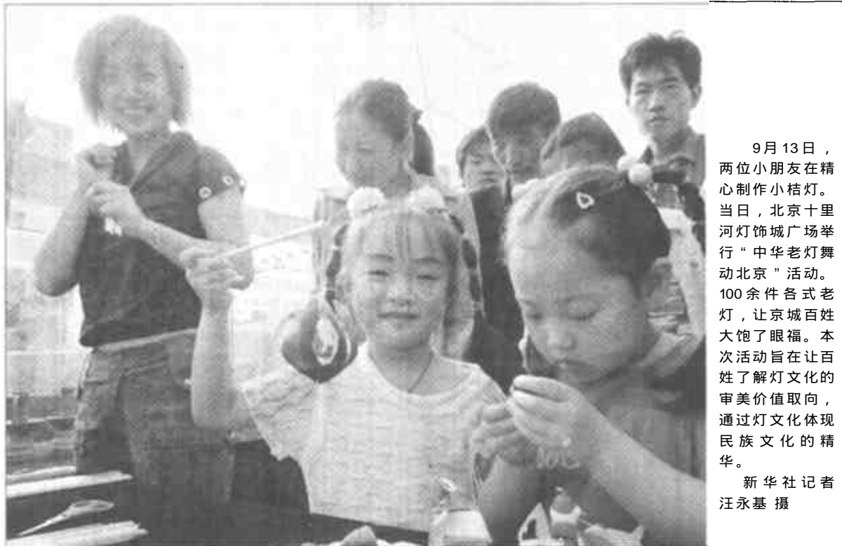
9月13日，两位小朋友在精心制作小灯笼。当日，北京十里河灯饰城广场举行“中华老灯舞动北京”活动。100余件各式老灯，让京城百姓大饱了眼福。本次活动旨在让百姓了解灯文化的审美价值取向，通过灯文化体现民族文化的精华。 新华社记者 汪永基摄

整的第二次飞跃。 魏建国说，世纪之交，我国抓住了世贸组织带来的新机遇，积极承接以IT为代表的高科技生产环节的大规模转移，初步形成了长三角、珠三角、环渤海湾各具特色的IT产业基地，进入了高新技术产品出口拉动机电产品出口快速增长的新阶段。