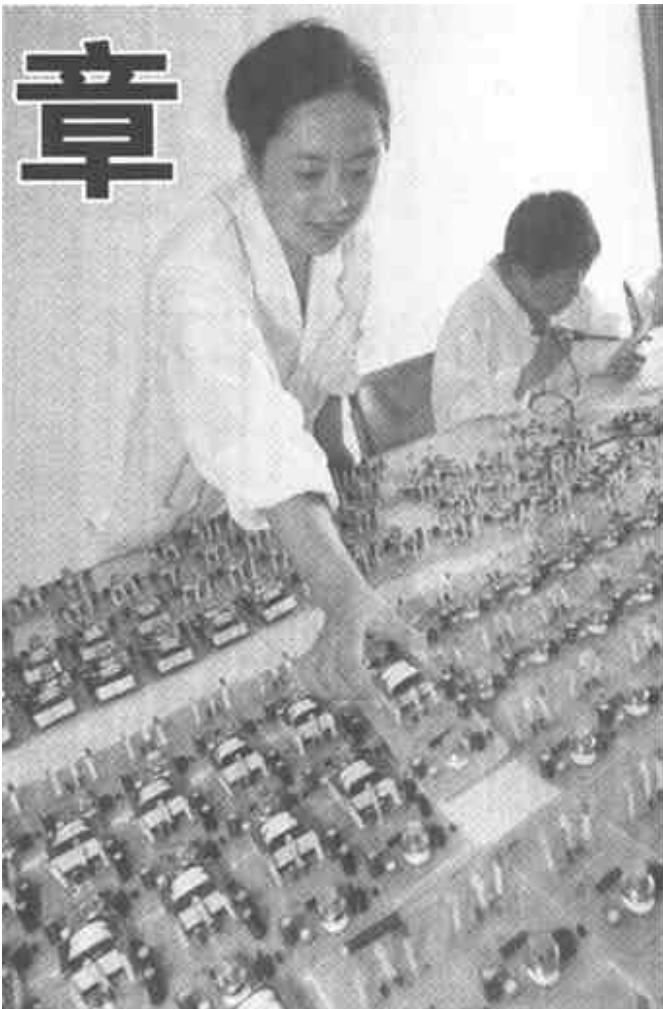
压题照片：石油大学科技园一角。

在同呼吸共命运的高亢主旋律中，卓有成效的帮扶工作成为合作的一道亮丽风景线。从1998年至今，油田共实施地方帮扶项目达184个，项目总投资3.2亿元，其中油田投资(含物料、机械折款)8869万元。总投资超过100万元以上的帮扶项目达82个。通过帮扶，乡镇的经济实力、财政收入、农民人均纯收入有了明显提高，双方干部相互共同交流，增进了友谊。帮扶工作也成为新时期油地校结合工作的典范工程。在共兴共荣的大环境下，维护油区秩序被历次领导联席会议确定为重要议题，“油区治安重中之重”的方针理念深深扎根在各方各级干部群众心中。共建油地联防指挥中心，联合召开企业共建全国安全文明油区大会，油区秩序保持持续稳定，开创了全市油区环境历史上最好的局面。