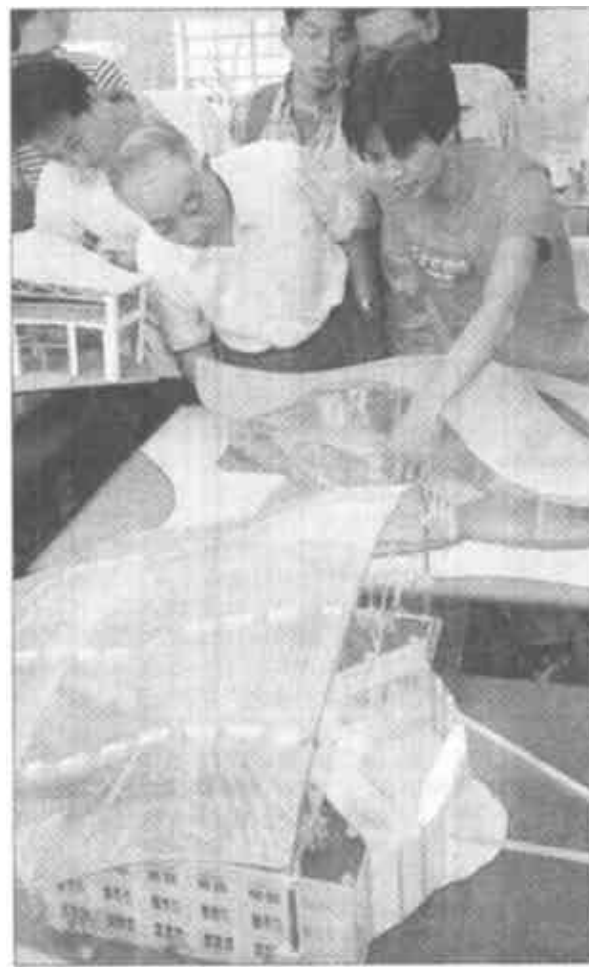
9月13日，南京河海大学同学向评委老师介绍自己设计制作的建筑模型。为培养学生的创新意识和动手能力，南京河海大学每年都举办一次学生创新大赛。2003年创新大赛的主题是“今后校区建设设计制作学校标志性建筑模型”。参加本次创新大赛的共有200名学生，他们的作品受到评委团专家的好评。

树立全心全意为人民服务的宗旨，切实加强自身队伍建设，努力提高政治业务素质 and 拒腐防变能力；全面贯彻“依法行政，为国把关，服务经济，促进发展”的工作方针，严格通关管理，坚决打击各种走私犯罪活动，推动我国外贸健康稳定发展；继续强化依法征管、科学征管，努力实现全年税收目标，为增强国家财力多作贡献。 吴仪、周永康、曹刚川、王刚、华建敏参加了会见。